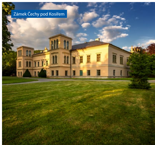
Zámek Čechy pod Kosířem